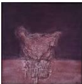
César MANRIQUE Enredado , 1991 T. mixta/arpillera/tabla 110 x 110 cm

Se ha dejado una obra de la colección FCM en depósito, para la muestra permanente del Museo de Arte Contemporáneo de Santa Cruz de La Palma. La obra es: