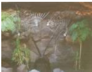
César MANRIQUE Sin título , c. 1981-83 Acero pintado 192 x 121 x 137 cm

Se restauró la escultura de acero pintado de negro de César Manrique: