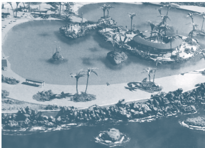
Maqueta del Lago Martiánez en Puerto de la Cruz, 1971.