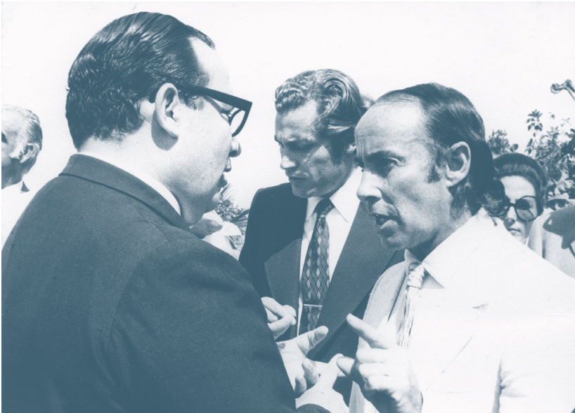
César Manrique con el ministro Sánchez Bella durante la visita oficial a las piscinas de Martiánez, Puerto de la Cruz, Tenerife, 1971.