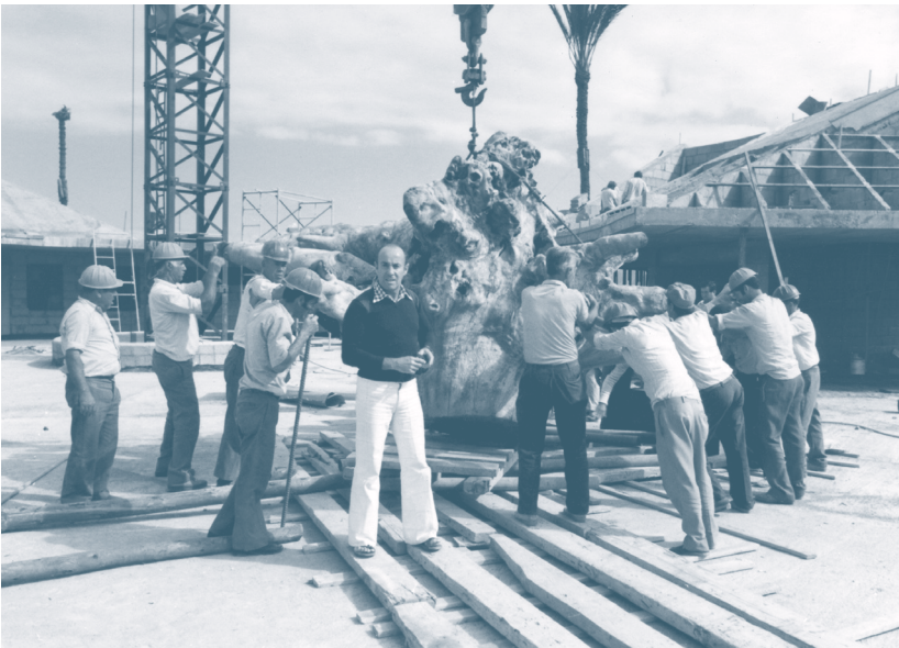
César Manrique con los trabajadores del Lago Martíánez durante el montaje de la escultura Orgón (Homenaje a Wilhelm Reich), Puerto de la Cruz, 1977.