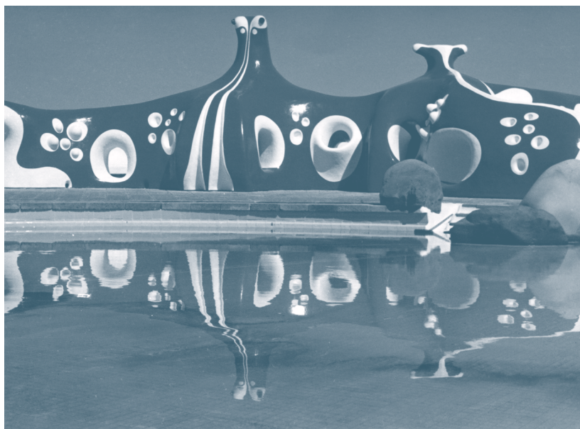
La jibia, escultura de César Manrique junto a la piscina infantil en Martiánez, Puerto de la Cruz, Tenerife, 1971.