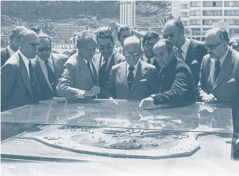
César Manrique mostrando la maqueta del Lago al ministro de Información y Turismo León Herrera Esteban durante su visita a las piscinas de Martíánez, Puerto de la Cruz, 19 de abril de 1975.