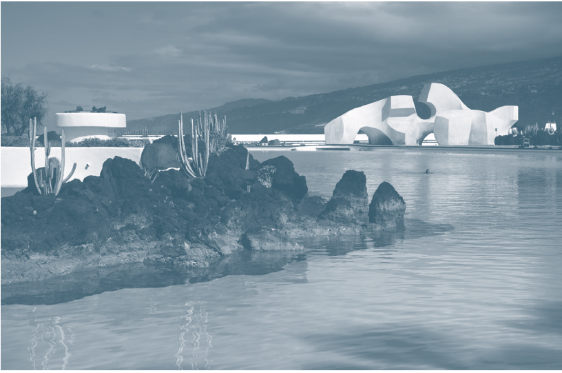
Homenaje al mar , escultura de César Manrique en el Lago Martiánez, Puerto de la Cruz, Tenerife, 1977.