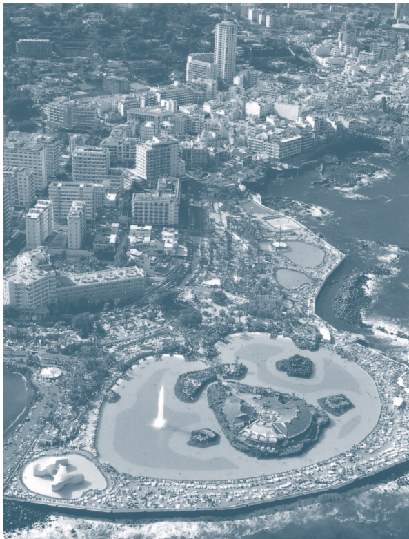
Vista aérea del complejo de Martínez, Puerto de la Cruz, Tenerife.