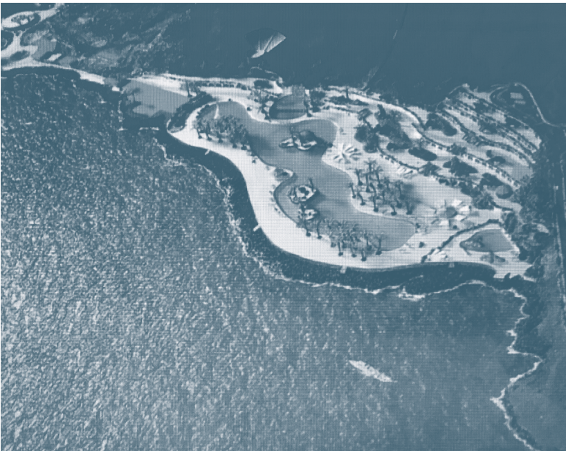
Maqueta del anteproyecto del parque marítimo de El Confital, Las Palmas de Gran Canaria, 1991. Reproducida en la revista Anarda , 1 de enero de 2001.